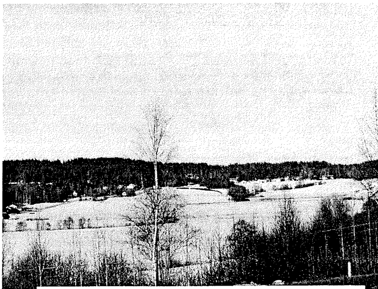
Vv över Ström taget från Torns kyrka