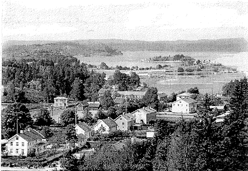
Ett gammalt foto över Henån