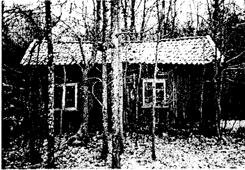
Stugan som den ser ut idag